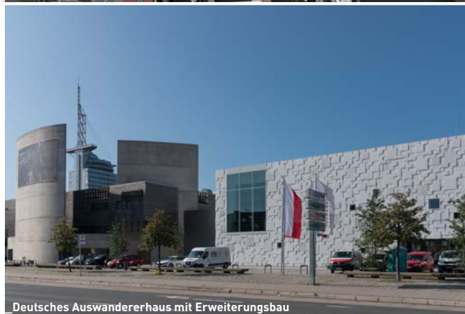
Deutsches Auswandererhaus mit Erweiterungsbau