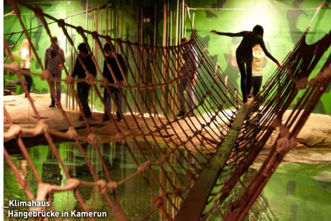
Klimahaus Hängebrücke in Kamerun