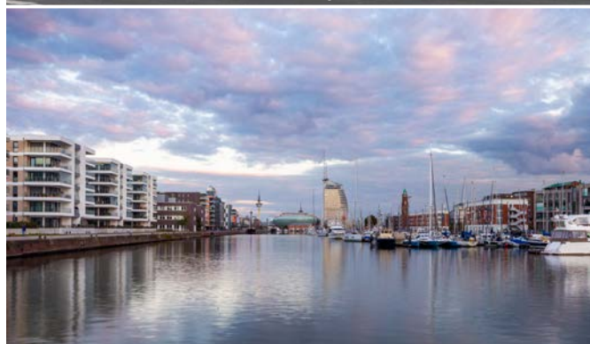
Neues Wohnen und Arbeiten am Wasser, Foto: GfG/ Michel Iffländer