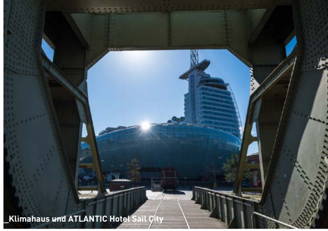
Klimahaus und ATLANTIC Hotel Sail City

Aufgrund der exponierten Lage am Wasser, der positiven wirtschaftlichen, städtebaulichen und touristischen Impulse in den vergangenen Jahren und wachsender überregionaler Aufmerksamkeit hat sich Bremerhaven zu einem attraktiven Arbeits-, Wohn- und Lebensstandort entwickelt.