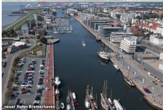
neuer Hafen Bremerhaven