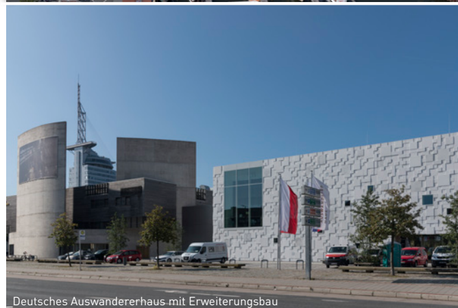
Deutsches Auswandererhaus mit Erweiterungsbau