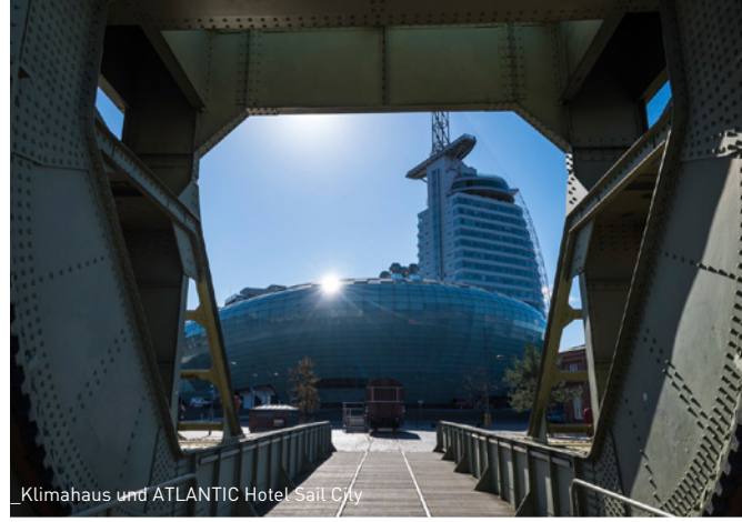
Klimahaus und ATLANTIC Hotel Sail City

Aufgrund der exponierten Lage am Wasser, der positiven wirtschaftlichen, städtebaulichen und touristischen Impulse in den vergangenen Jahren und wachsender überregionaler Aufmerksamkeit hat sich Bremerhaven zu einem attraktiven Arbeits-, Wohn- und Lebensstandort entwickelt.