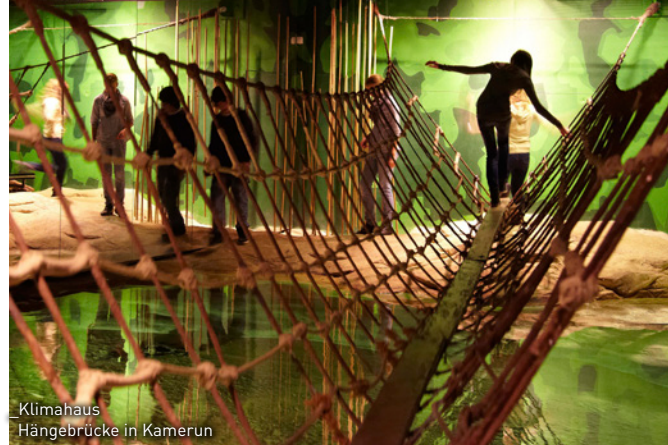
Klimahaus Hängebrücke in Kamerun