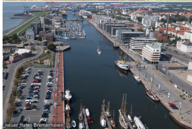
neuer Hafen Bremerhaven