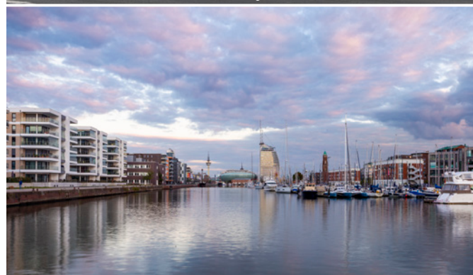
Neues Wohnen und Arbeiten am Wasser, Foto: GfG/ Michel Iffländer