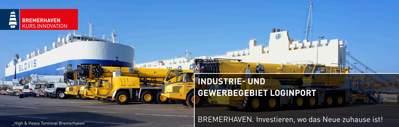
_High & Heavy Terminal Bremerhaven