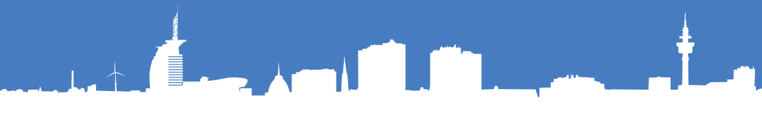
Konzeption, Text und Umsetzung: bigbenreklamebureau gmbh | Stand: 09-2022

Bremerhavener Gesellschaft für Investitionsförderung und Stadtentwicklung mbH bis